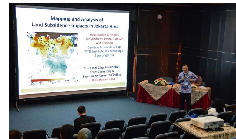
研究成果発表会でのプレゼンテーション