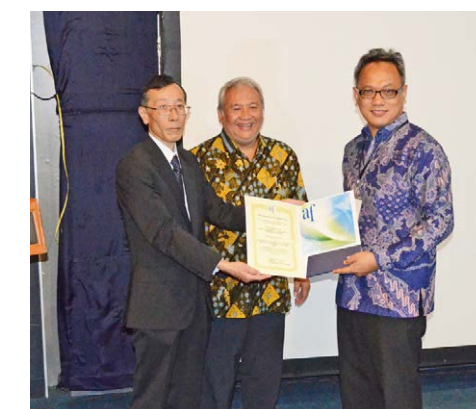
安達専務理事による贈呈状の授与