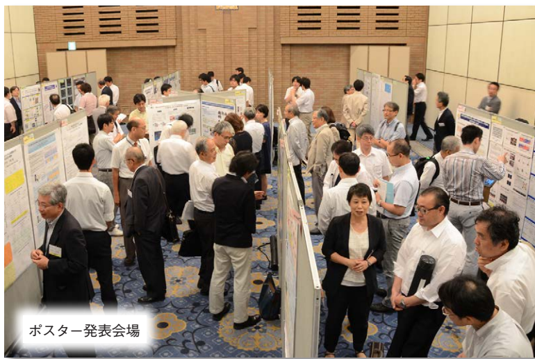
ポスター発表会場