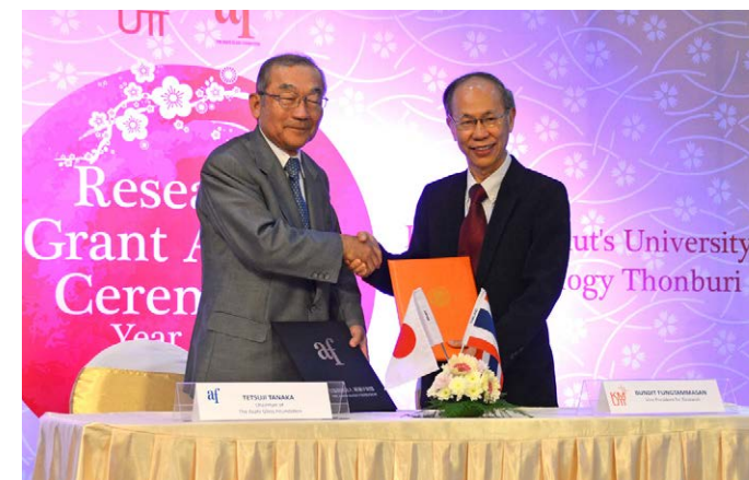
Fungtammasan 副学長と田中理事長による MOU の取交し

新規助成対象者5名のパネルによる研究予定内容の紹介や贈呈状の授与が行われ、その後、過年度の助成対象者7名の研究成果が発表されました。