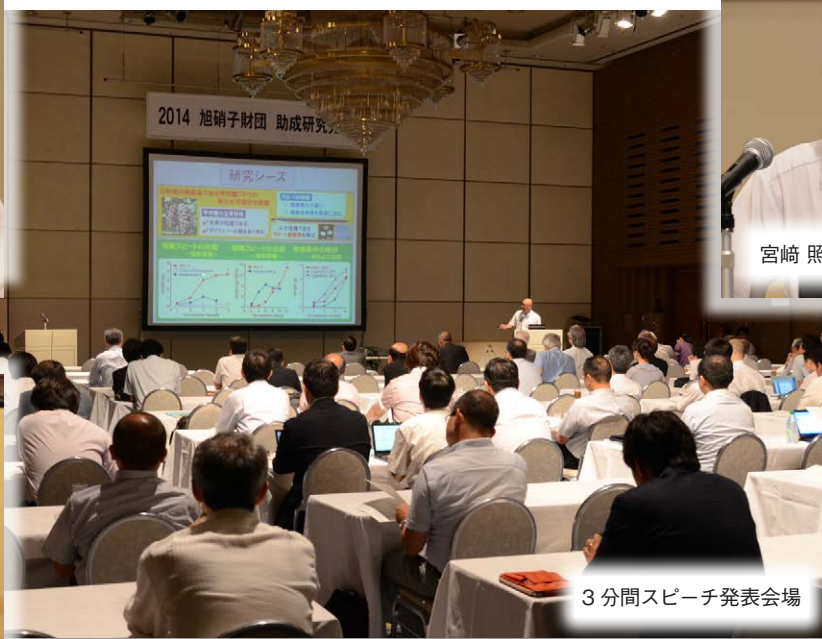
3分間スピーチ発表会場