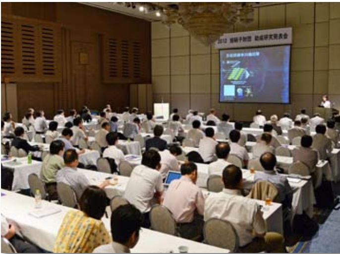
3分間スピーチ発表会場