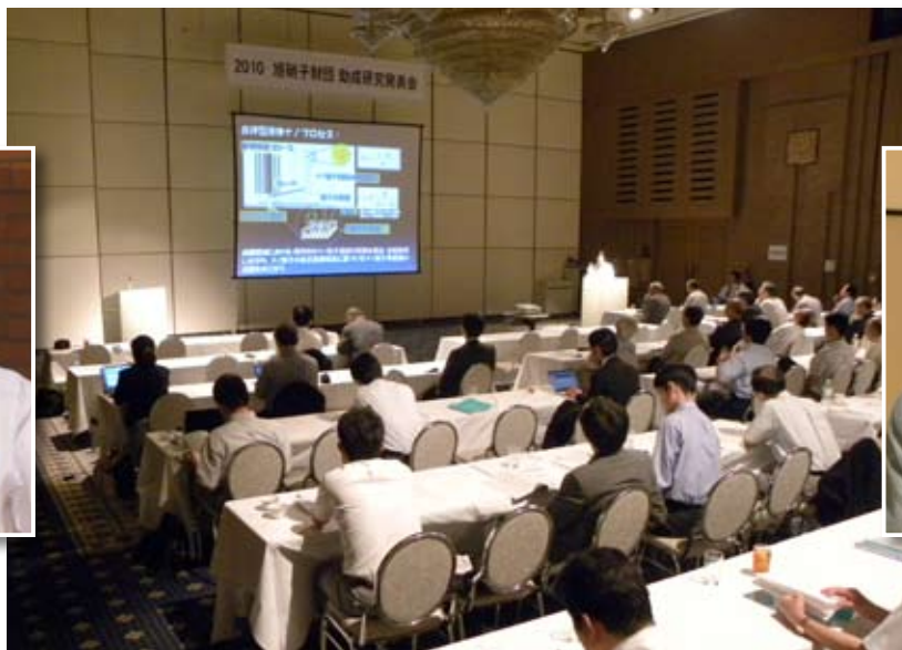
3分間スピーチ発表会場